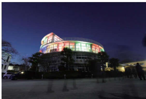
(参考図版) BUILDING DIGNITY 館田市浜井小学校 2018年