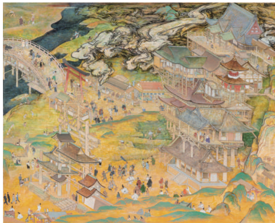
(特別展示) 山口晃《深山寺参詣圖》1994年 群馬県立館林美術館 〔展示期間：9月21日～11月10日〕