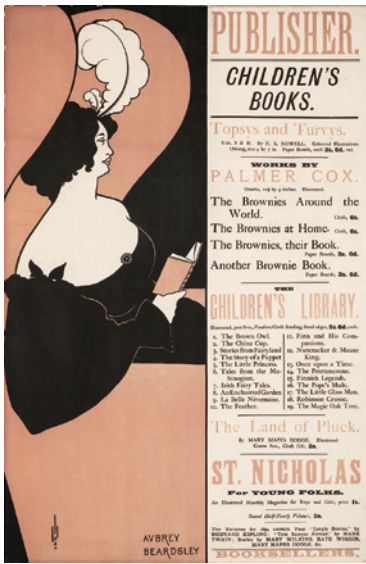
オーブリー・ピアズリー『子供の本』(T. フィッシャー・アンウィン社)の宣伝ポスター 1894年、石版画