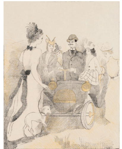
マリー・ローランサン『最初のルノー車』1936年、石版画