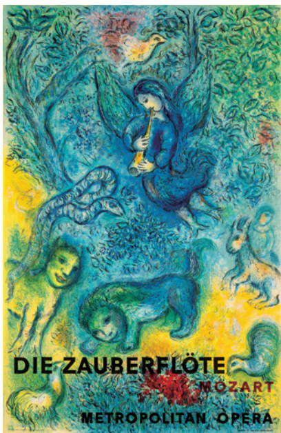
マルク・シャガール『魔笛』メトロポリタン・オペラ 1967年、石版画 ©ADAGP, Paris & JASPAR, Tokyo, 2023, Chagall® B0635