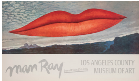
マン・レイ『ロサンゼルス・カウンティ美術館での展覧会ポスター』 1966年、オフセット・リトグラフ ©MAN RAY 2015 TRUST / ADAGP, Paris & JASPAR, Tokyo, 2023 B0635

19世紀に興隆したポスターに新しい表現の可能性をみだした芸術家たちは、互いに競うように、観る人の印象に残る、想像力豊かで、ときに遊び心のある作品を創り出し、やがては自らの個展や出版物の告知など、自己宣伝にも活用していきます。さらに20世紀半ばには、高い技術と芸術性をあわせ持つ印刷所ムルコ工房が、美術館や画廊の展覧会ポスター制作を担い、芸術と広告の領域をさらに融合させていきました。この展覧会では、約160点の作品により、シエレ、ミュシャ、ピアズリーら19世紀の先駆者たちの試み、20世紀の巨匠シャガール、マティス、ピカソ、ミロ、ダリらによるポスター芸術の確立と、戦後の展開をたどります。色鮮やかで心躍るポスターの競演を、どうぞお楽しみください。