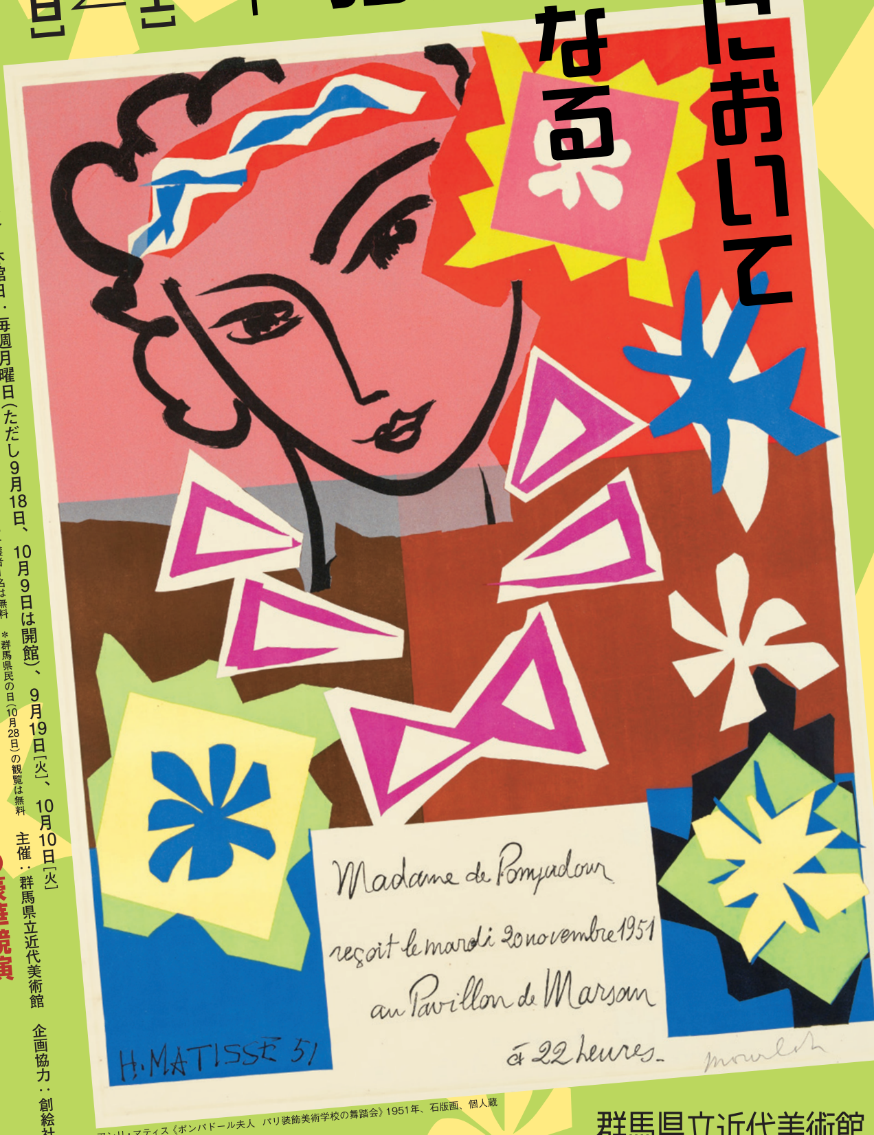
アンリ・マティス〈ボンパドール夫人 バリ装飾美術学校の舞踏会〉1951年、石版画、個人蔵

休館日：毎週月曜日（ただし9月18日、10月9日は開館）、9月19日「火」、10月10日「火」 *中学生以下、障害者手帳等をお持ちの方とその介護者1名は無料 *群馬県民の日（10月28日）の観覧は無料 主催：群馬県立近代美術館 企画協力：創絵社 巨匠たちのポスターの豪華競演