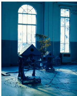
駒形克哉《無題》1985年