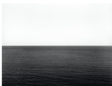
杉本博司《カリブ海、ジャマイカ》1980年