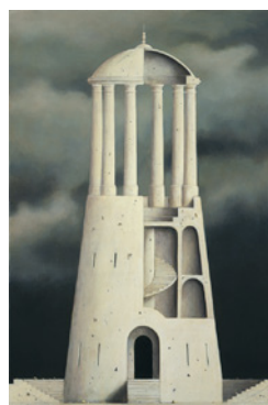
野又穫《Still-14 静かな庭園》1986年