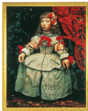
森村泰昌《美術史の娘 王女A》1989年