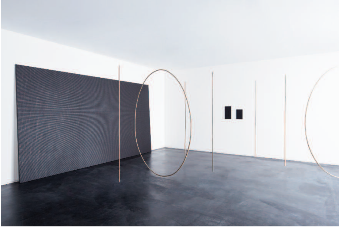
Photo 3 | マリア・タニグチ 展示風景/タカ・イシイ ギャラリー 東京/2017年